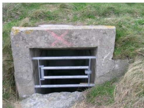
Grille de protection d'un ancien blockhaus