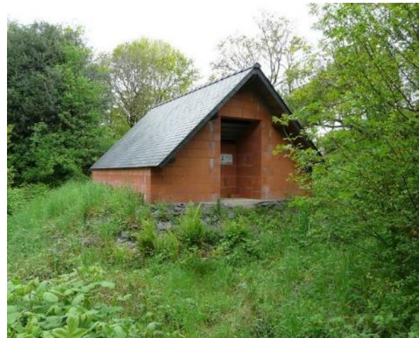
Le bâtiment avant et après enterrement de la partie basse