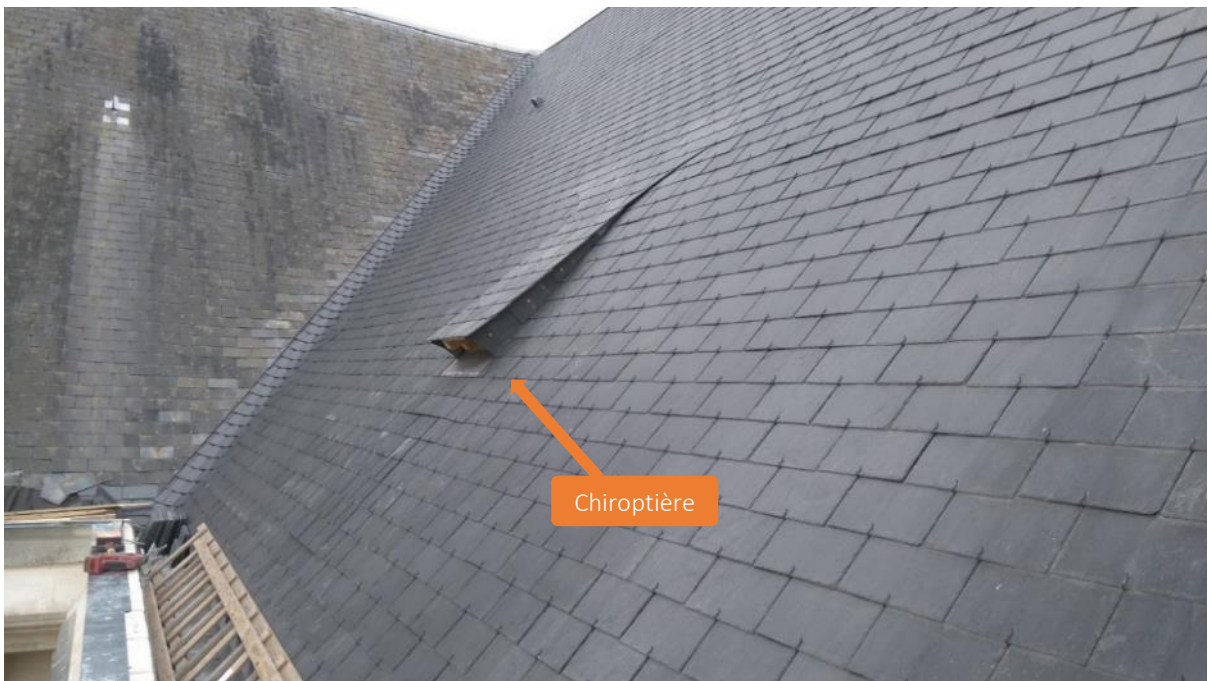
Aménagement d'un accès aux combles pour une colonie de mise-bas de chauves-souris

Groupe Mammalogique Breton • www.gmb.bzh