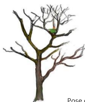
Pose d'un gîte à écureuils