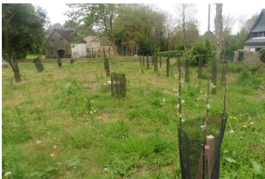
Plantation d'un verger