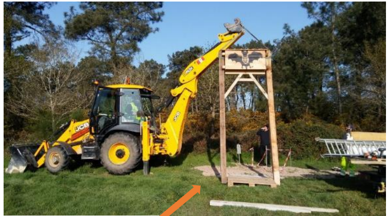
Gros nichoirs sur pilotis