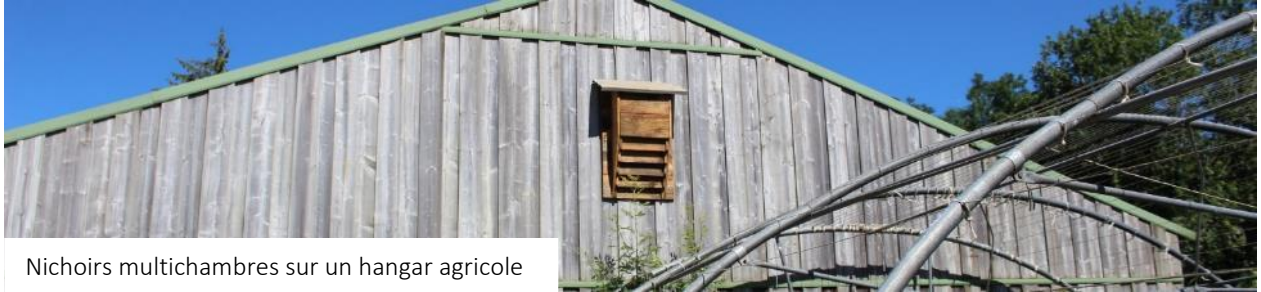
Nichoirs multichambres sur un hangar agricole