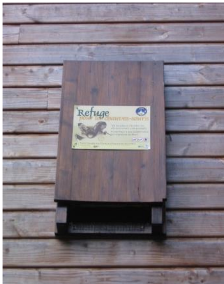
Nichoir fixé sur un mur