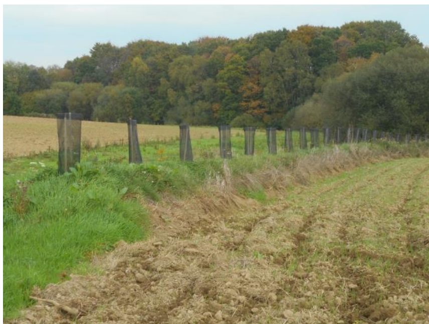
Reconstitution d'une haie bocagère sur talus