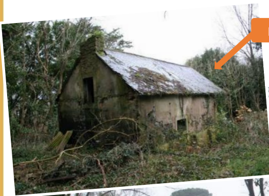
Le bâtiment avant les travaux

Groupe Mammalogique Breton • www.gmb.bzh