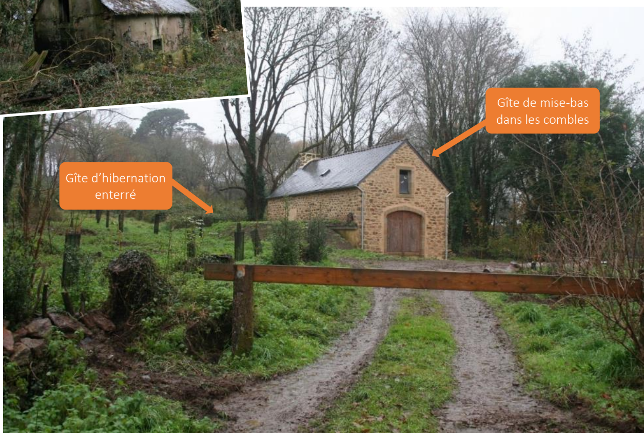
Gîte d'hibernation enterré