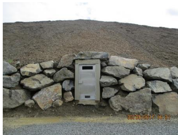
Souterrain créé de toute pièce pour les chauves-souris dans une carrière, avant et après recouvrement.