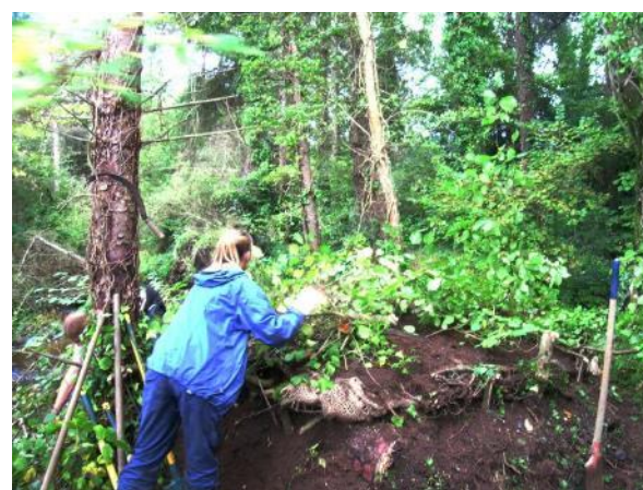
Construction de catiches artificielles pour la Loutre (avant et après recouvrement)