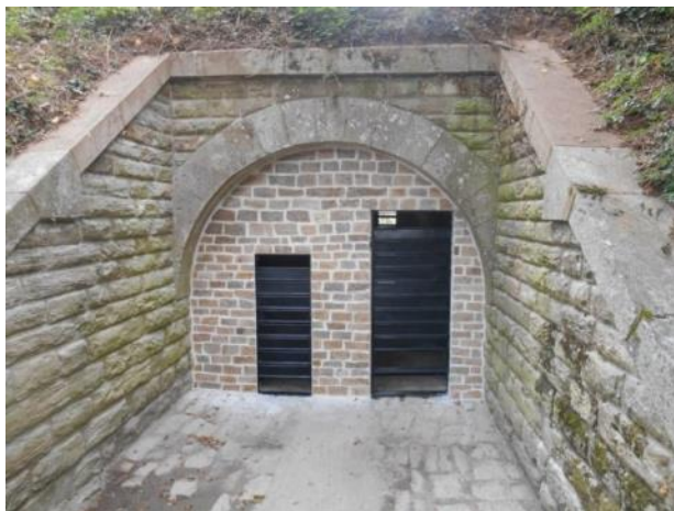
Aménagement de tunnels pour l'hibernation des chauves-souris