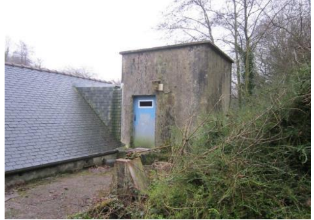
Découpe du haut d'une porte pour les chauves-souris