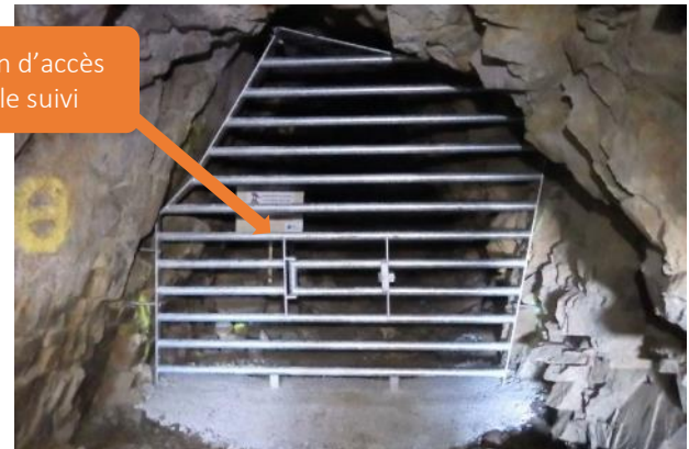
Grille de protection de sites d'hibernation dans d'anciennes ardoisières