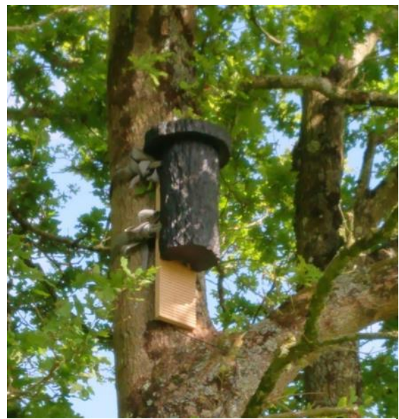
Nichoirs à chauves-souris arboricoles

Groupe Mammalogique Breton • www.gmb.bzh