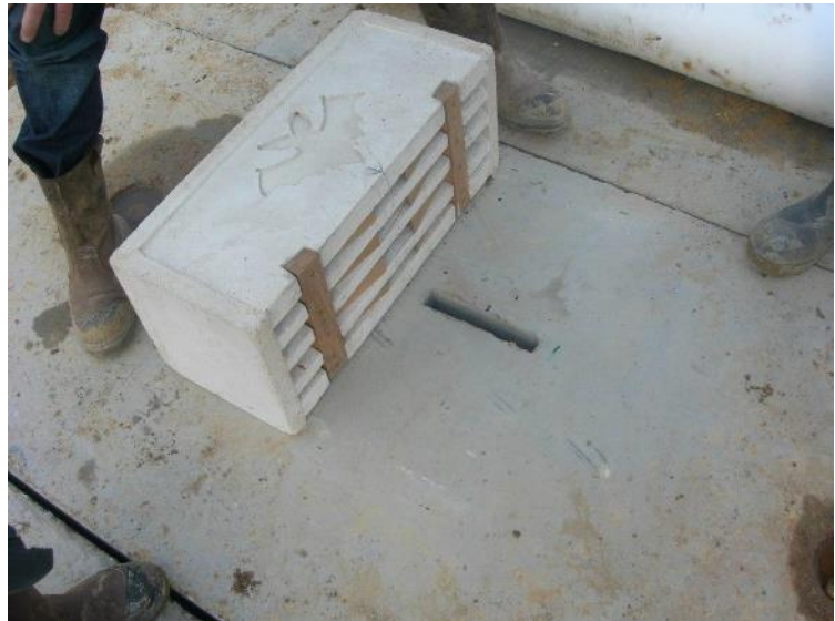
Nichoir à intégrer sous le tablier d'un pont