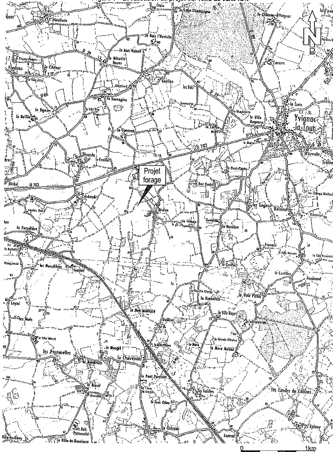
Figure 1 – Localisation du projet sur fond de carte IGN