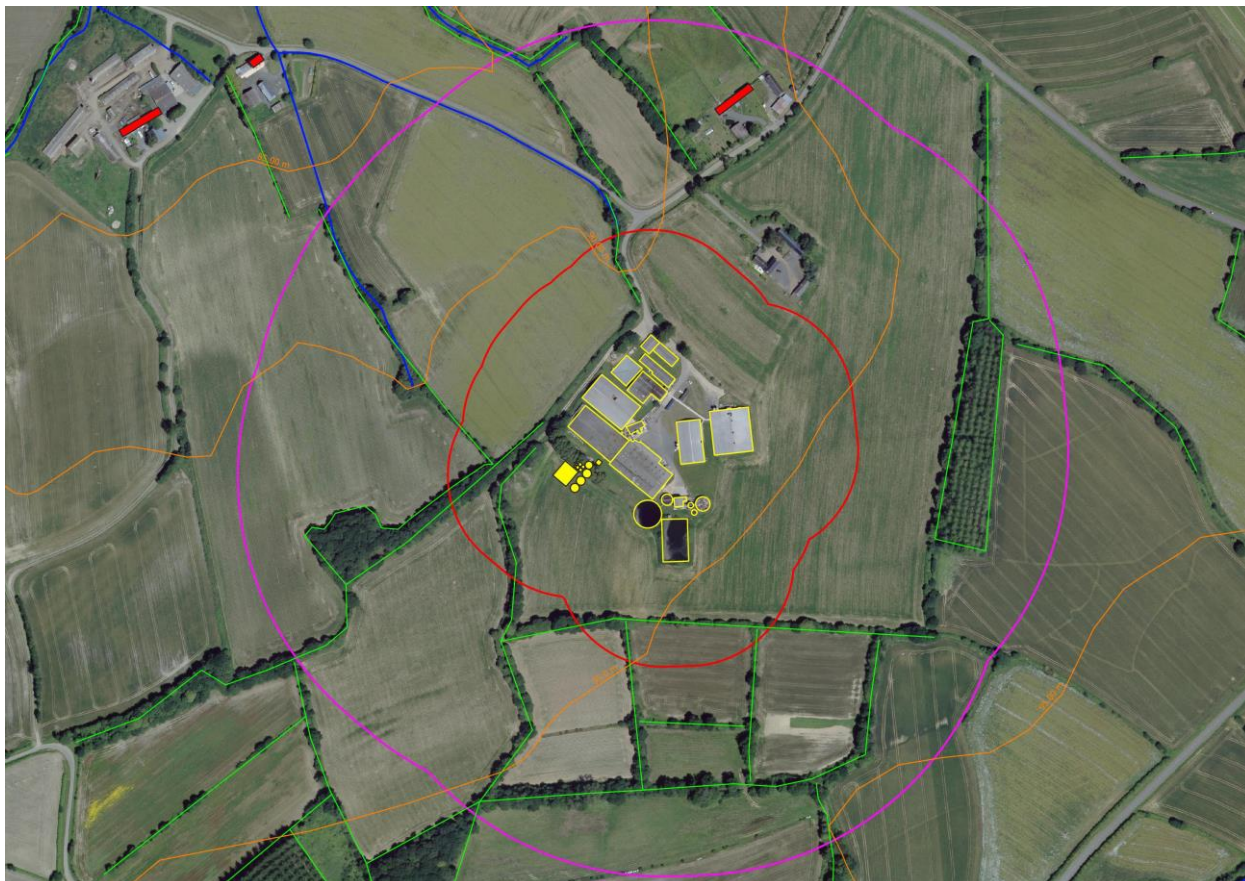
Vue aérienne du site avec représentation des rayons de 100 et 300 m par rapport au projet

Au niveau paysager, seuls les silos tours et la cellule seront visibles des tiers les plus proches au nord. En effet les autres silos et hangars seront à la même hauteur que les bâtiments d'élevage et seront donc masqués par ceux par rapport aux tiers.