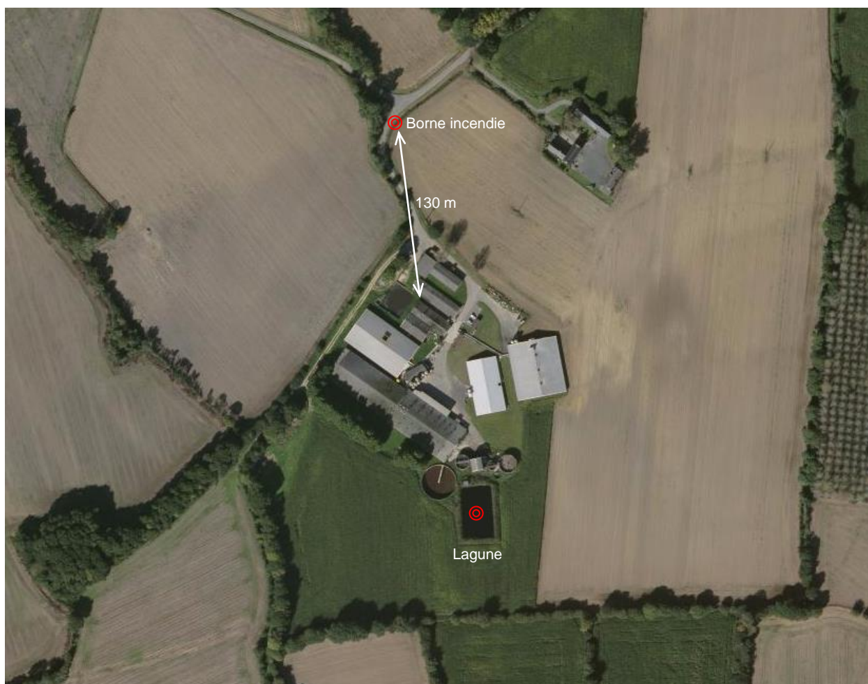
Localisation des moyens de défense incendie externe