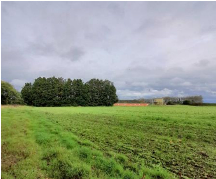
Vue avant projet