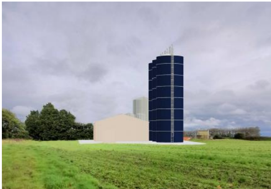
Vue après projet