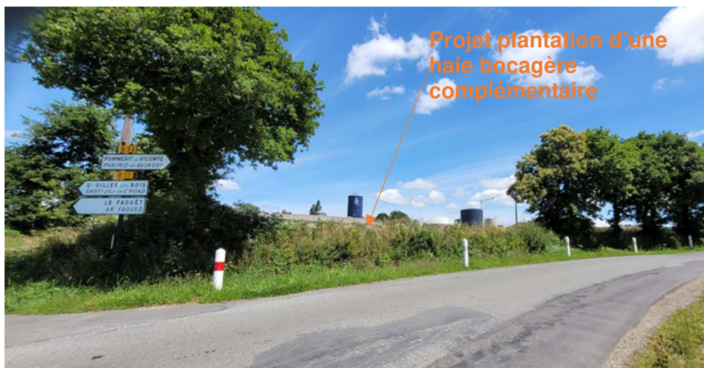
Photo "P1 : Vue de l'intersection de la D77 et la D32 direction Nord Est (Juin 2022)