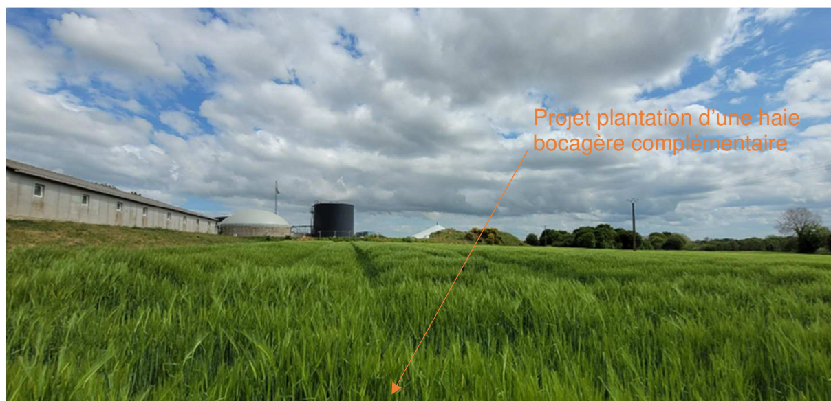
Photo P4 : Vue proche de la route D77 direction SUD EST (Juin 2022)